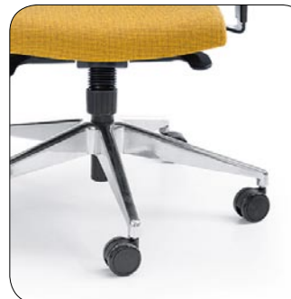
chrome base Fußkreuz verchromt