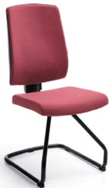
RAYA 21V BLACK