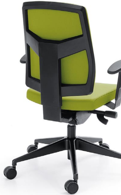
RAYA 23SL BLACK P49PU