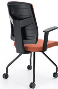
RAYA 21H BLACK P46PU CASTORS