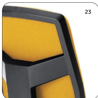
plastic Rücken Kunststoff