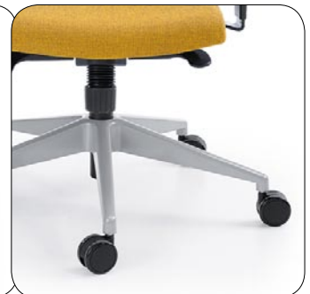
metallic base Fußkreuz weißalu