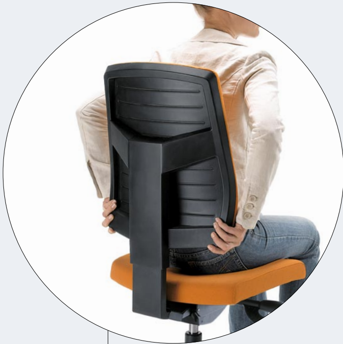
Backrest height adjustment (in swivel version) Rückenhöhenverstellung (Drehstuhl)