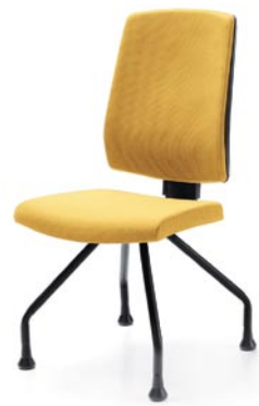
RAYA 23H BLACK GLIDES