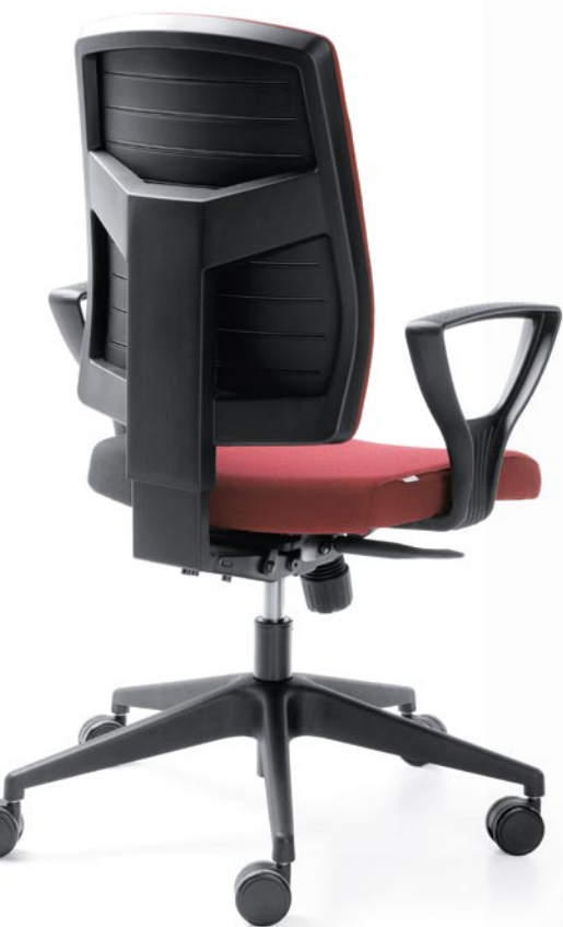
RAYA 21S BLACK P52PA