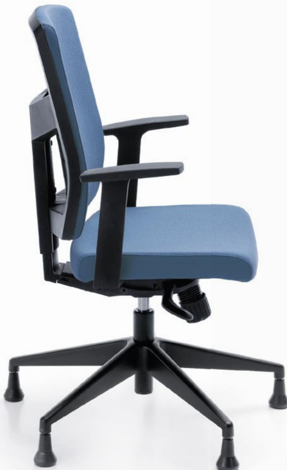
RAYA 21S BLACK P46PU