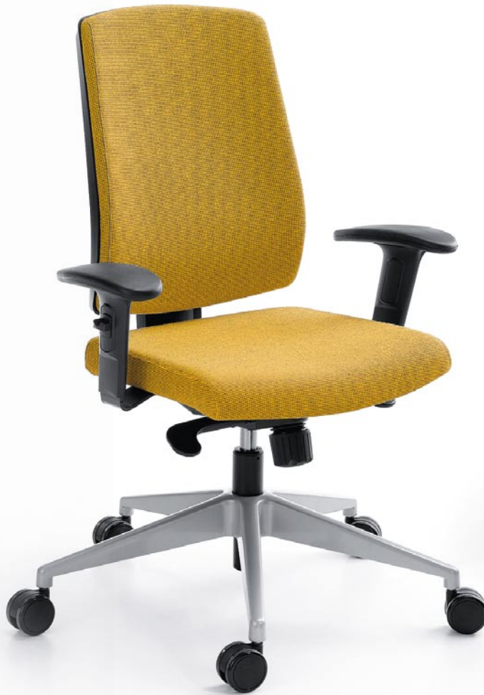
RAYA 21S BLACK P49PU + METALLIC BASE