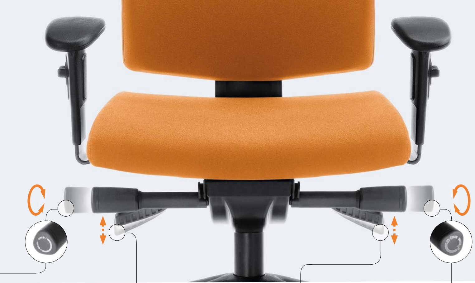
Seat height adjustment Sitzhöhenverstellung