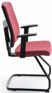
RAYA 21V BLACK P46PU