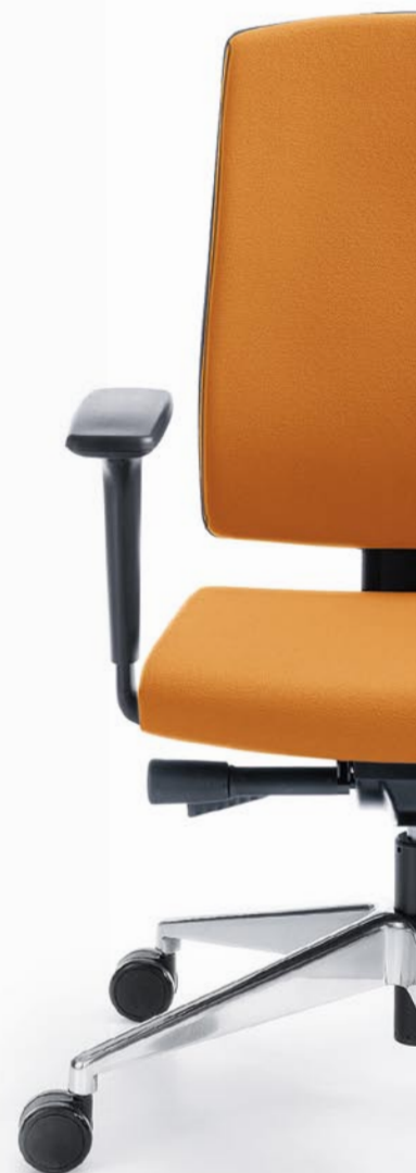
RAYA 23SL BLACK P51PU + CHROME BASE