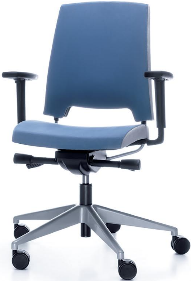
ARCA 21SL METALLIC P54PU