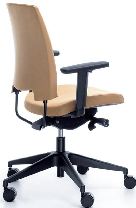
ARCA 21SL BLACK P54PU