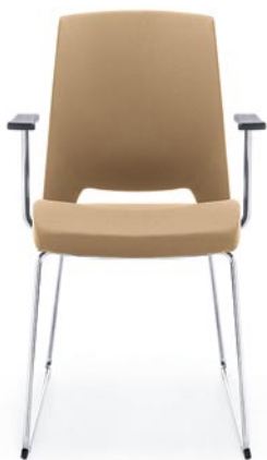
ARCA 21V CHROME PP