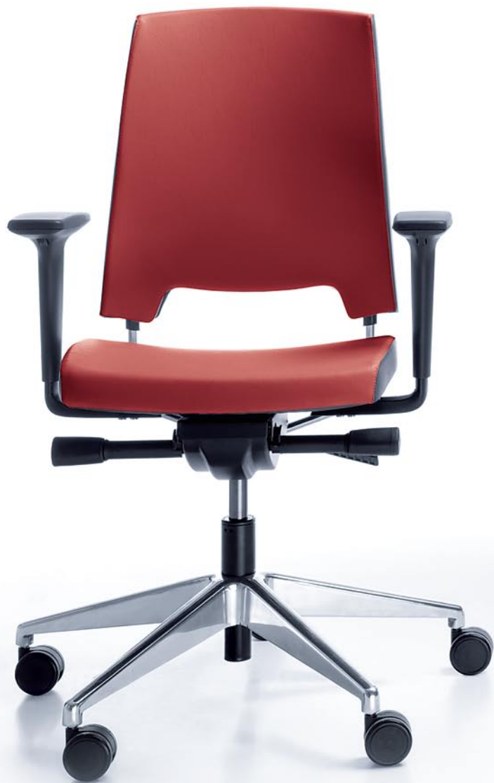
ARCA 21SL CHROME P51PU