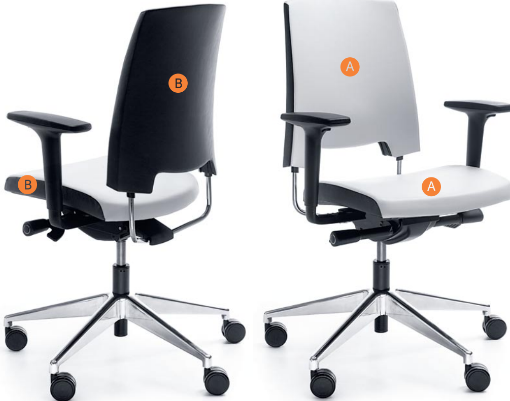
ARCA 21SL CHROME P51PU