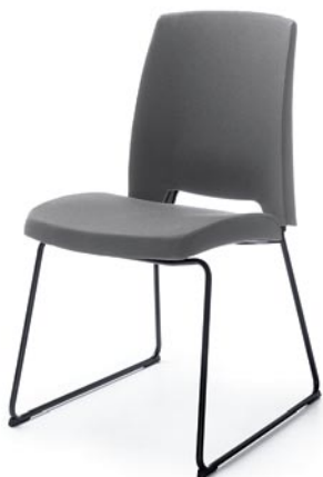
ARCA 21V BLACK