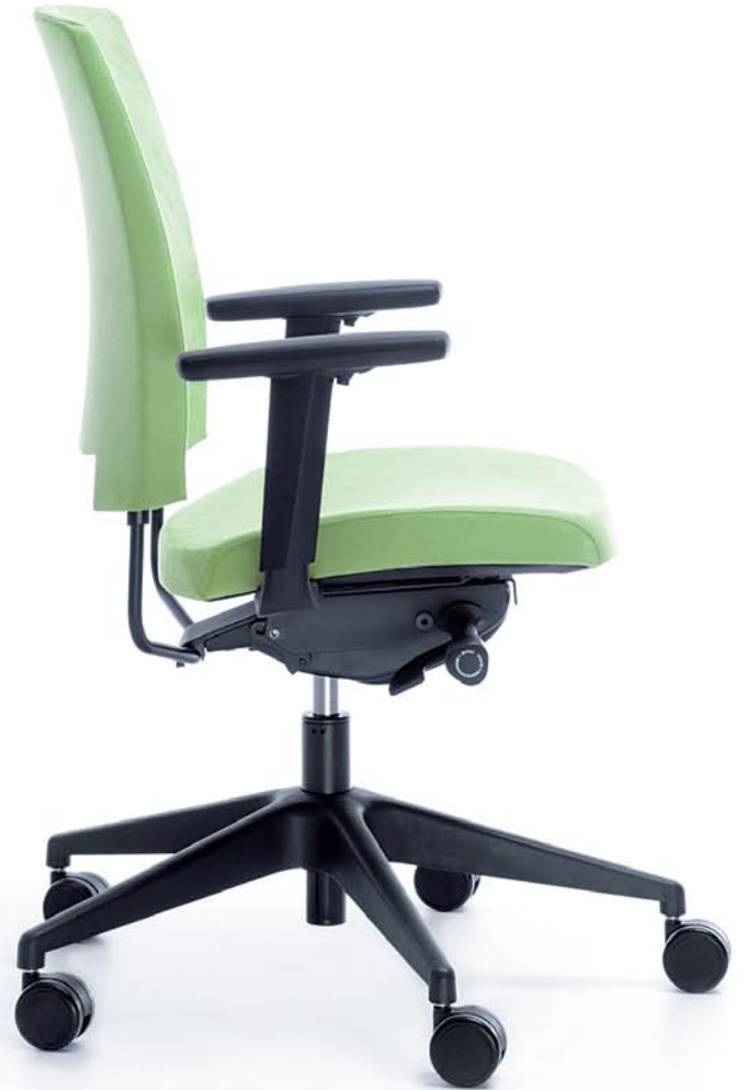
ARCA 21SL BLACK P54PU