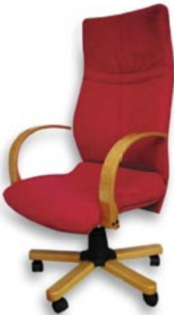
WEST FOX dřevo 37-01-55-4