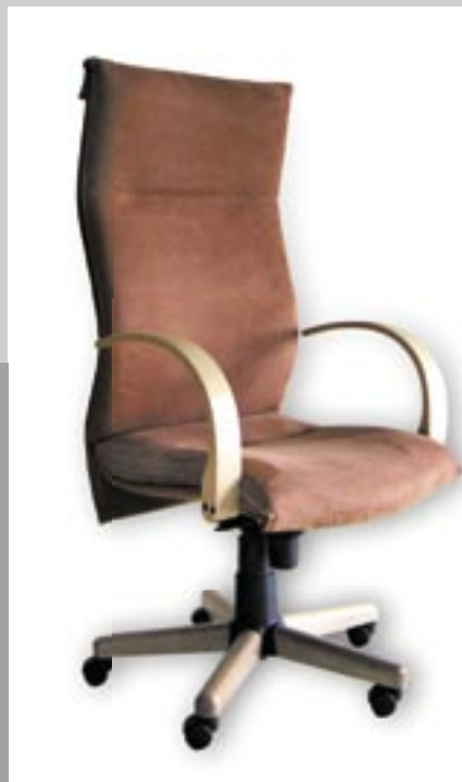
WEST dřevo 35-01-55-4