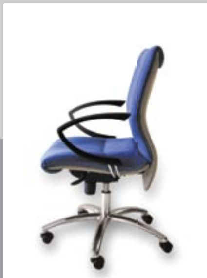
WEST nízký chrom 35-03-56-3