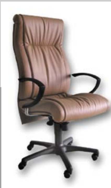
WEST NOVA plast 36-01-56-1