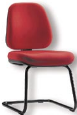
PETRA jednací 03 09-03-14-1