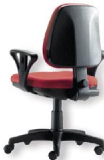
PETRA nízká 09-03-10-1