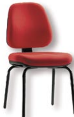
PETRA jednací 04 09-03-15-1