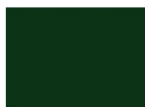
zelená - (R...