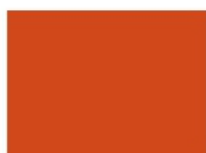
oranžová - ...