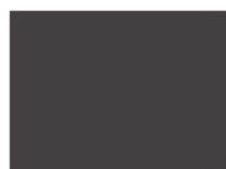
antracit - (...