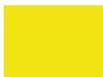
žlutá - (RA...