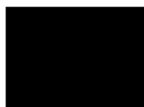
černá - (RA...